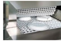
▲ネットコンベア部分